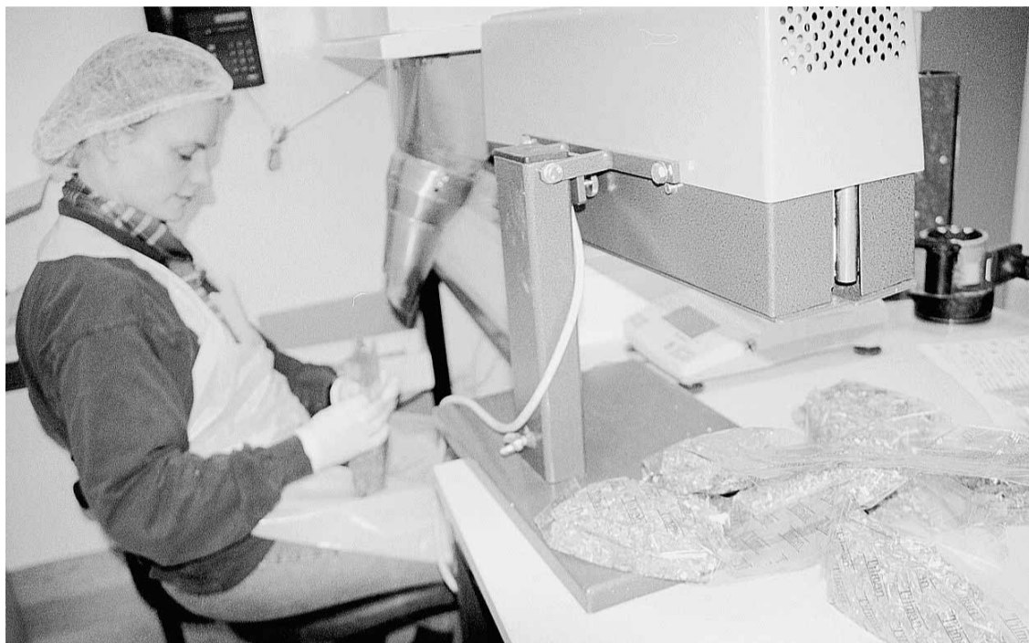
Cinquante ans après sa création, la "Tisane du Vieil Ardennais" est fabriquée à Baillonville.